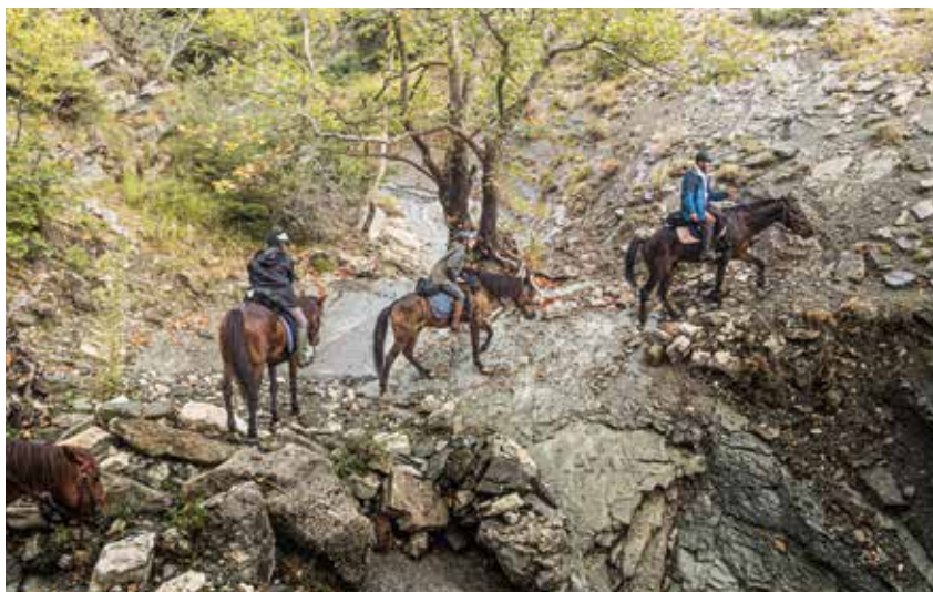
Die Wege sind oft steil und sehr schmal, Sattelfestigkeit ist trotz der trittsicheren Albanischen Pferde ein Muss.