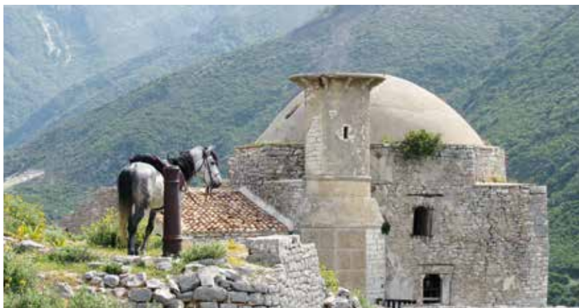
Die Burg von Borsh, eine der historischen Stätten entlang der Route auf den Spuren von König Skerdilajd.