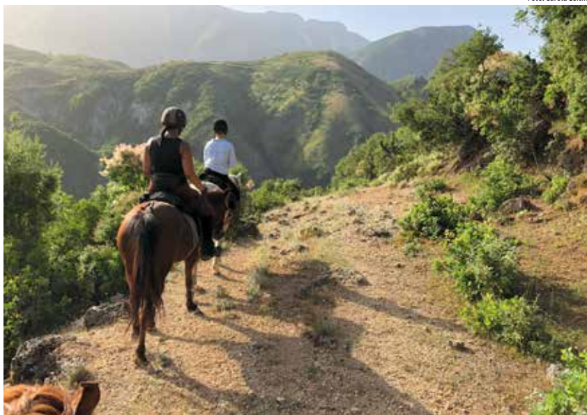
In den Bergen und Wäldern ist die Natur nahezu unberührt, eine Zauberwelt mit artenreicher Flora und Fauna.