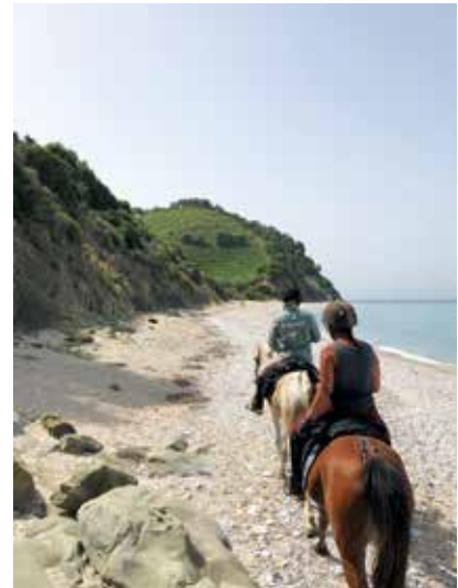
Ritt am menschenleeren Strand des Ionischen Meeres

den gleichen Stellenwert. In den schönsten Olivenhainen mit Zikadengesängen finden sich illegale Müllkippen, Berge vollgestopfter Plastiksäcke, kaputte Möbelstücke usw. Besonders stark ist die Vermüllung in der Nähe menschlicher